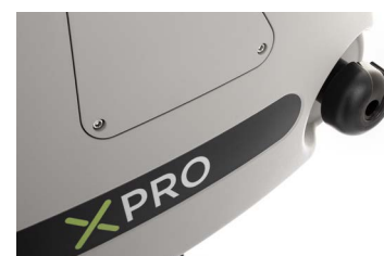
Pressione della laminazione regolabile