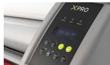
Pannello di controllo semplice e intuitivo