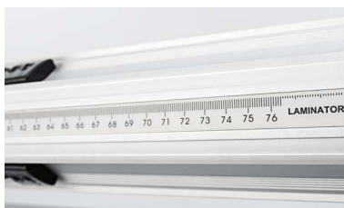
Scala millimetrata sugli alberi per il corretto posizionamento del materiale