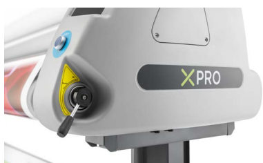
Sollevamento/abbassamento pneumatico del rullo tramite leva