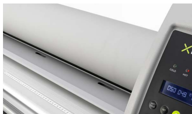
Rulli in silicone antiadesivi