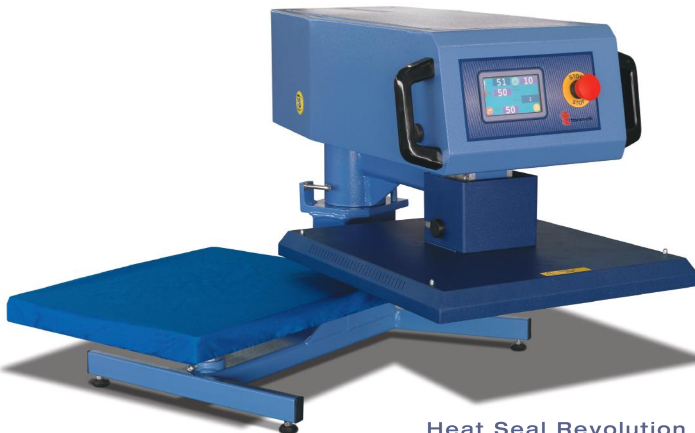
Heat Seal Revolution