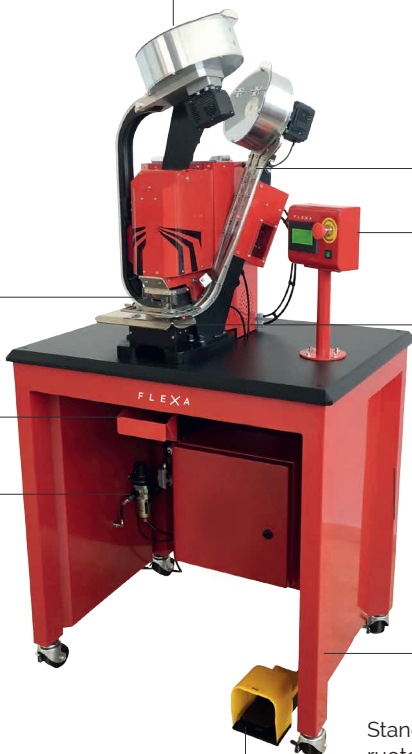
Azionamento a pedale (operazioni a mani libere)