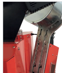
Doppia corsia di discesa per la distribuzione delle rondelle