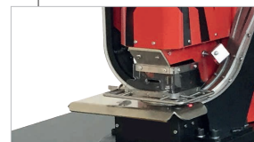
Superficie di scorrimento del materiale in acciaio inox