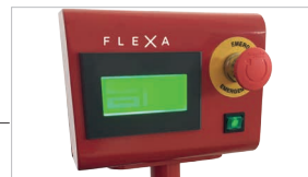
Pannello di controllo touch facile da usare