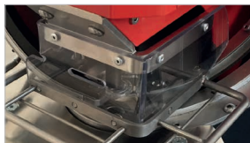
Area di lavoro protetta da carter trasparenti