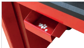
Cassetto estraibile di raccolta degli sfridi di perforazione