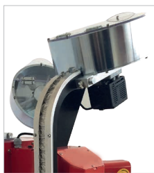
Serbatoi di grande capacità per occhelli e rondelle