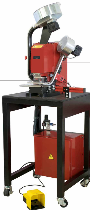
Azionamento a pedale (operazioni a mani libere)