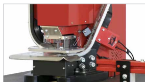
Area di lavoro protetta da carter trasparenti