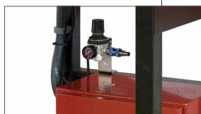
Funziona con compressore (6 bar) per l'alimentazione degli occhielli (accessorio non incluso)