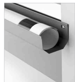
Vasca anteriore di supporto stampe per lavorare fogli singoli (optional)