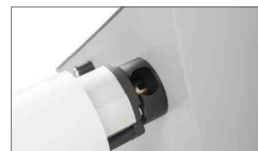
Alberi in alluminio con sistema automatico di aggancio e scala millimetrata per il corretto posizionamento del materiale