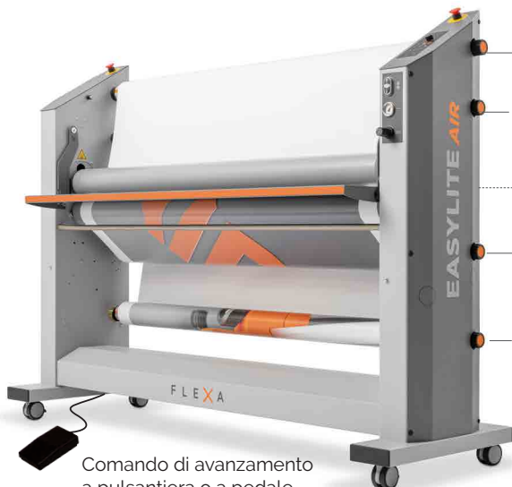
Comando di avanzamento a pulsantiera o a pedale (mani libere per la movimentazione del materiale)