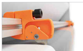
Cotelli con lama protetta per rifilare il materiale laminato senza rischi per l'operatore (optional)