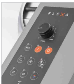
Pannello di controllo per impostazione temperatura, velocità e altro ancora