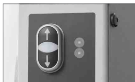
Pulsantiera per il sollevamento e abbassamento pneumatico del rullo superiore