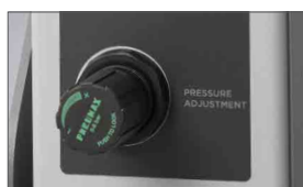
Regolatore di pressione del rullo superiore