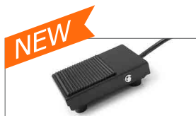
Pedale sul lato posteriore per la discesa del rullo ed agevolare le operazioni