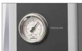
Manometro per visualizzare la pressione del rullo superiore