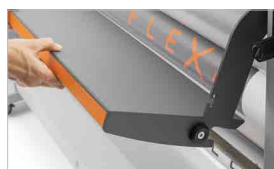
Piano di lavoro anteriore in acciaio e basculante per settaggio veloce delle bobine